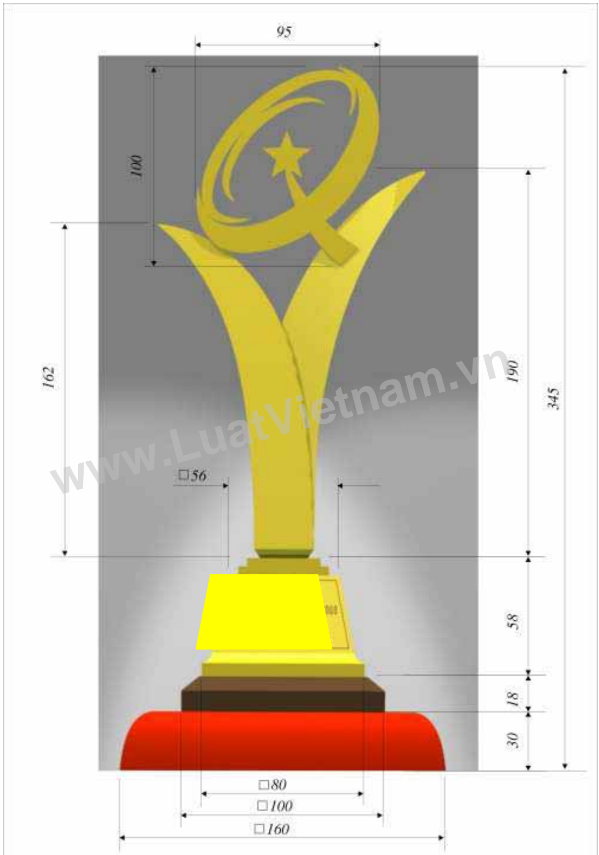
Hình 3: Kích thước mặt trước của Cúp Giải thưởng Chất lượng Quốc gia