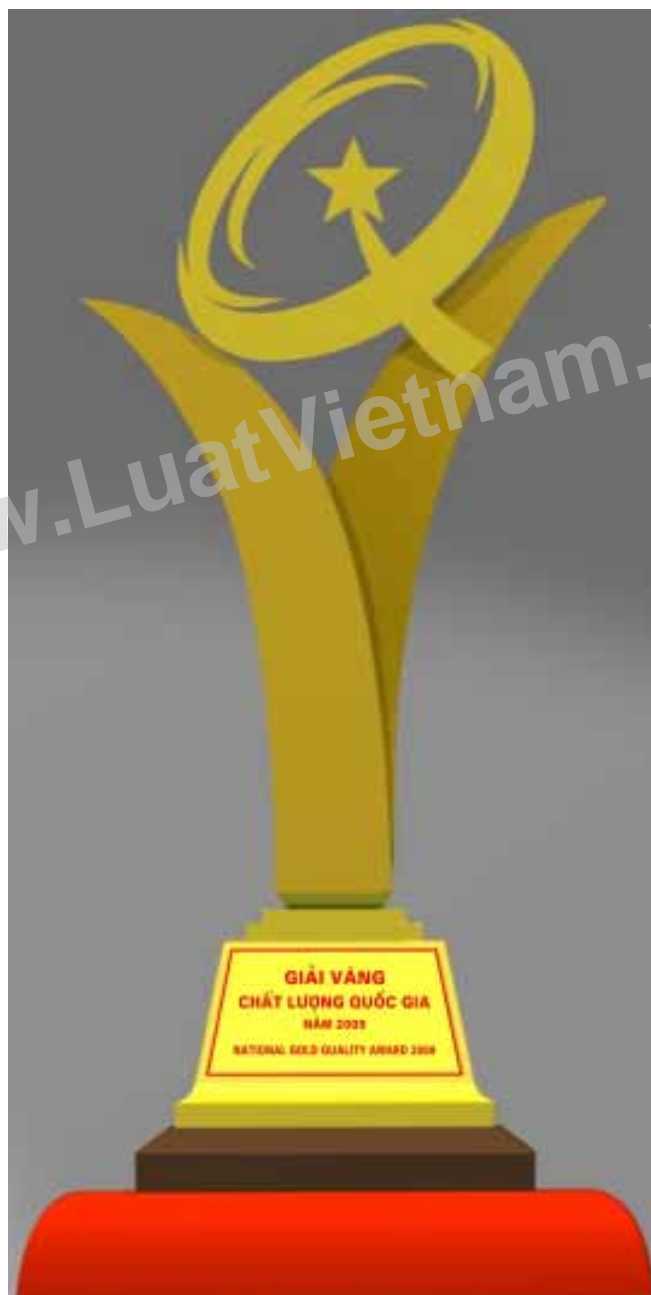
Hình 1: Hình dạng Cúp Vàng Giải thưởng Chất lượng Quốc gia

Cúp Vàng Giải thưởng Chất lượng Quốc gia và Cúp Bạc Giải thưởng Chất lượng Quốc gia