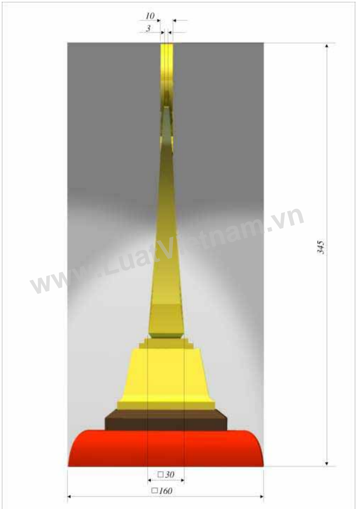
Hình 4: Kích thước mặt bên của Cúp Giải thưởng Chất lượng Quốc gia