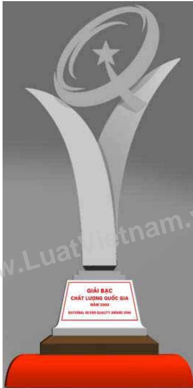
Hình 2: Hình dạng Cúp Bạc Giải thưởng Chất lượng Quốc gia